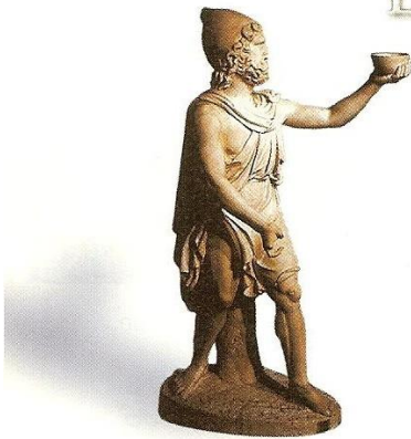
Odysseus vor Polyphem. Marmorstatuette. 2. Jh. n. Chr. Rom, Vatikanische Museen