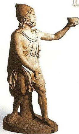
Odysseus vor Polyphem. Marmorstatuette. 2. Jh. n. Chr. Rom, Vatikanische Museen