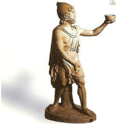
Odysseus vor Polyphem. Marmorstatuette. 2. Jh. n. Chr. Rom, Vatikanische Museen