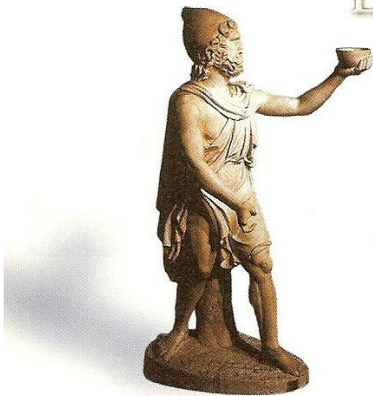
Odysseus vor Polyphem. Marmorstatuette. 2. Jh. n. Chr. Rom, Vatikanische Museen