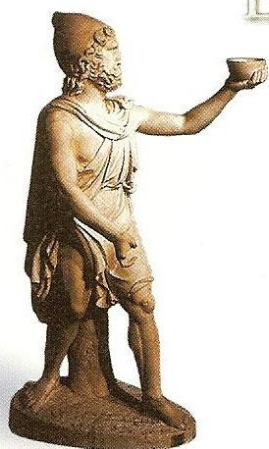
Odysseus vor Polyphem. Marmorstatuette. 2. Jh. n. Chr. Rom, Vatikanische Museen