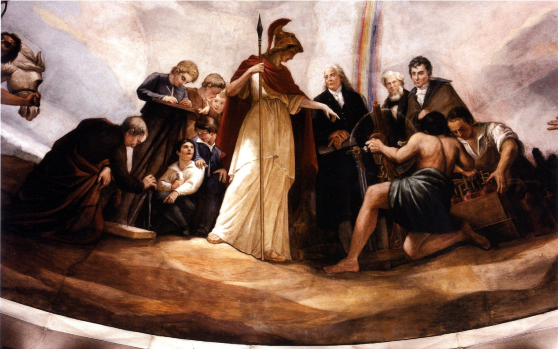
Abb. 11: „Science“