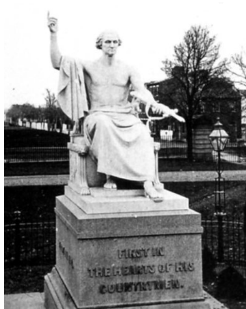
Abb. 13: George Washington von H. Greenough (National Museum of American History, Smithsonian Institution)