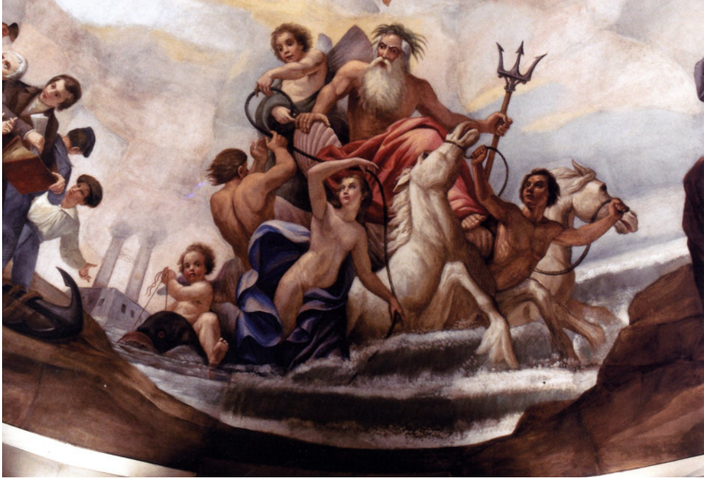
Abb. 10: „Marine“