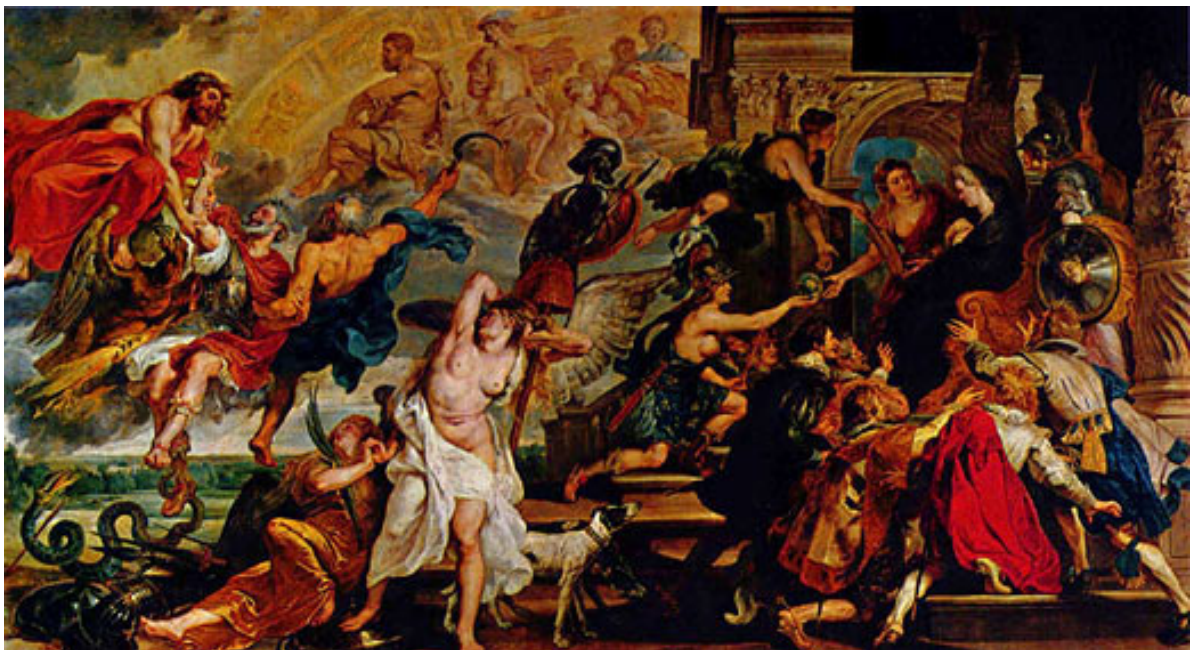
Abb. 2: P. P. Rubens, Apotheose Heinrichs IV. von Frankreich, 1621-1625 (Louvre, Paris)