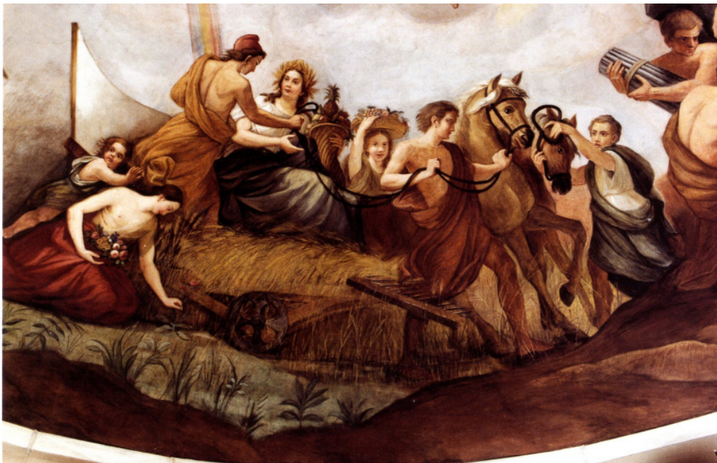
Abb. 7: „Agriculture“