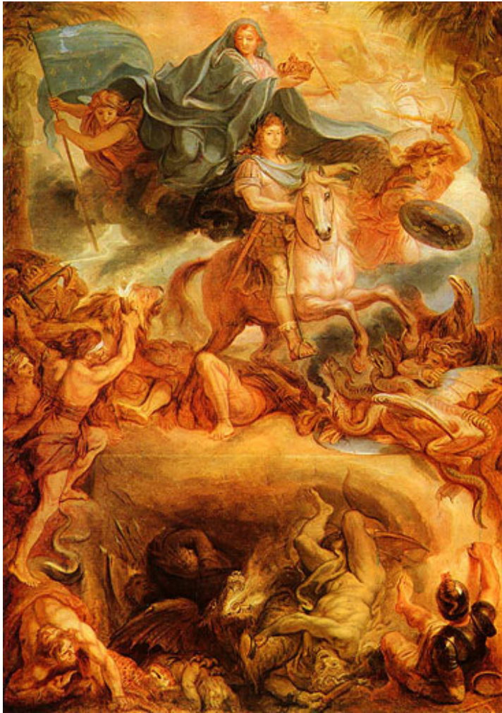
Abb. 3: Ch. Le Brun, Apotheose von Ludwig XIV, 1677 (Magyar Szépművészeti Múzeum, Budapest)