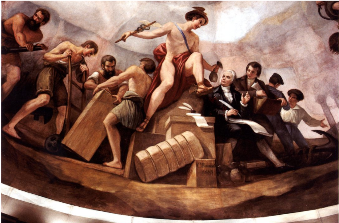
Abb. 9: „Commerce“