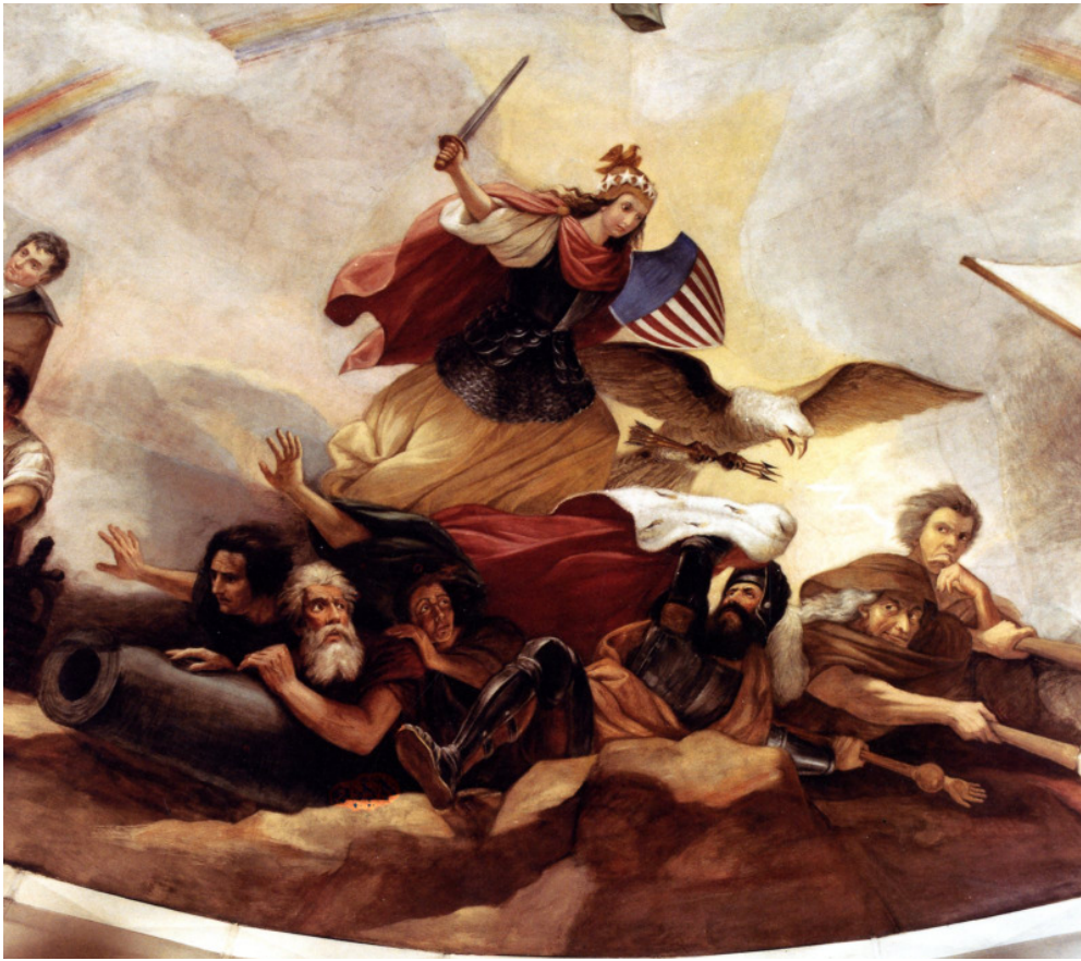
Abb. 12: „War“