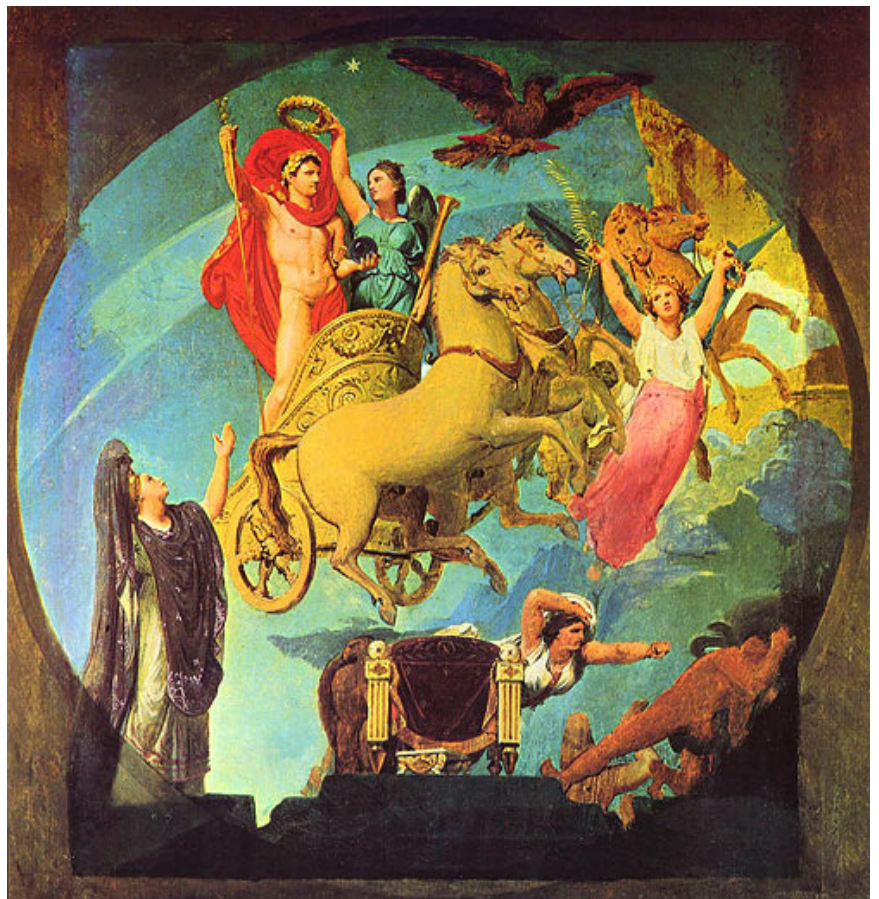
Abb. 4: J. A. D. Ingres, Apotheose Napoleons I., 1853 (Musée Carnavalet, Paris)