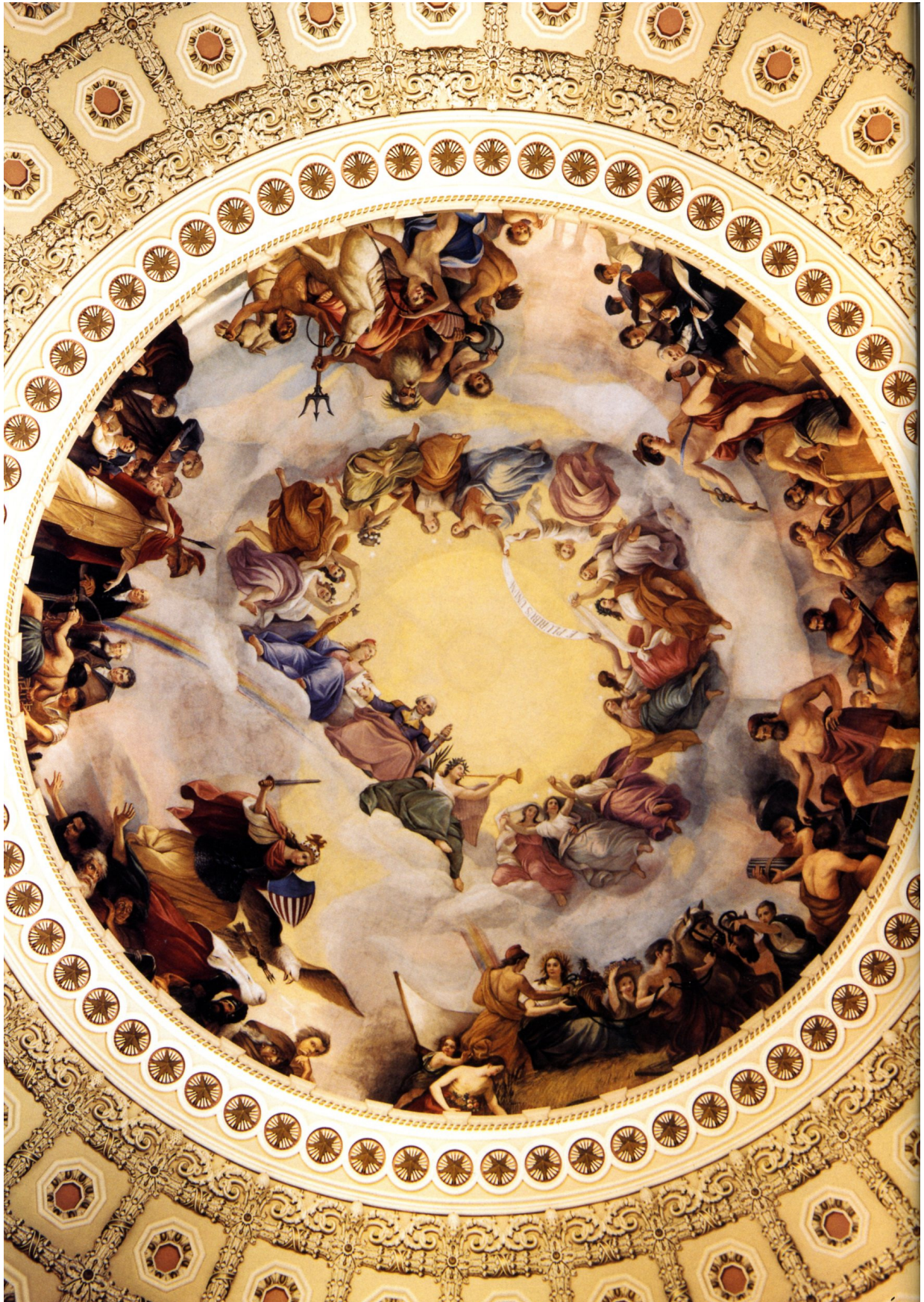
Abb. 5: Apotheose Washingtons. Kuppelfresko des US Capitol von C. Brumidi