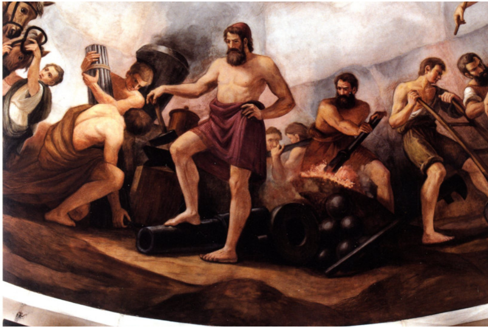
Abb. 8: „Mechanics“