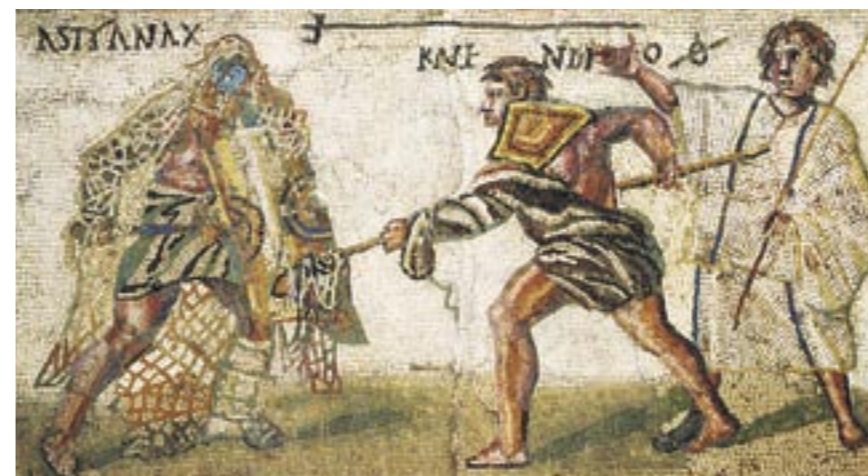
Ausschnitt aus einem römischen Mosaik; 4. Jahrhundert., Madrid, Museo Archeologico Nacional

18 Ulpus Traiānus imperātor hunc gladiātōrem optimum esse dicit – vidēte! Nunc hic petit – et ille cadit, sed rursus surgit. Urbicus iterum petit – iam galea 4 illius in terram cadit.